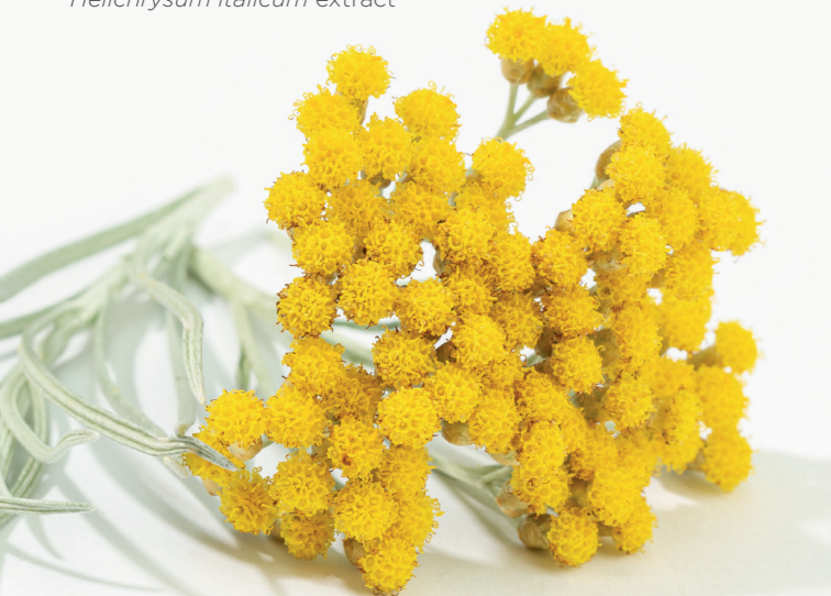
Ölmez Çiçek Ekstraktı Helichrysum italicum extract