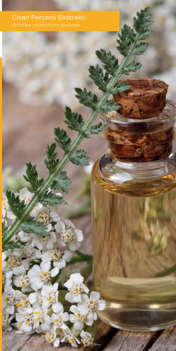
Civan Perçemi Ekstraktı Achillea millefolium ekstrakt

Geçmişten günümüze çeşitli kültürlerde kullanılmış ve günümüzde de popülerliğini koruyan Biberiye bitkisinin ve özenle seçilen diğer bitkilerin zengin içeriklerinden yararlanarak ürettiğimiz Greenext Hair-Care Kompleksini sizlere sunuyoruz.