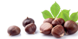
At Kestanesi Ekstraktı Aesculus hippocastanum extract Cilt derisinin altındaki yağ tabakasının erimesine ve derinin sıkılaşmasına yardımcı olmaktadır.

İçeriğinde bulunan bileşenler sayesinde cilt üzerindeki kan dolaşımını artırıcı etkiye sahiptir.