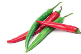
Acı Biber Ekstraktı Capsicum annuum extract İçeriğinde bulunan bileşenler sayesinde yağ yakımını hızlandırmaya ve selülit oluşumunun azalmasına yardımcı olmaktadır.