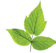
Huş Ağacı Yaprığı Ekstraktı Betula alba leaf extract

İçeriğinde bulunan bileşenler sayesinde cilt üzerindeki kan dolaşımını artırıcı etkiye sahiptir.