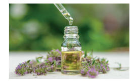
Kekik Uçucu Yağı Origanum onites Cilt üzerinde kan dolaşımını hızlandırarak selülitlerin görünümünün azaltılmasına yardımcı olur.