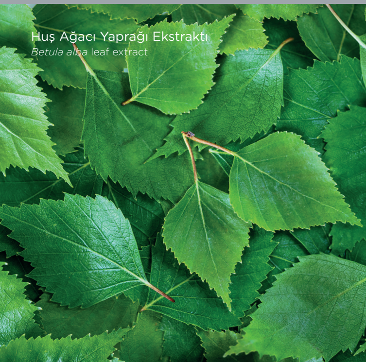
Huş Ağacı Yaprığı Ekstraktı Betula alba leaf extract