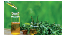
Biberiye Uçucu Yağı Rosmarinus officinalis Ciltteki selülit görünümünü azaltmaya yardımcı etkisi bulunmaktadır.

Glycerine, Menthol, Caffeine, Sodyum Benzoate, Potasyum Sorbate