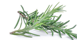
Biberiye Yaprığı Ekstraktı Rosmarinus officinalis leaf extract Selülit görünümünü azaltmaya yardımcı etkisi bulunmaktadır.